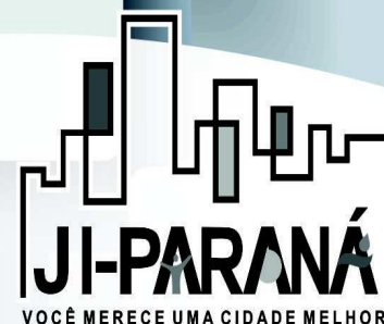
VOCÊ MERECE UMA CIDADE MELHOR!