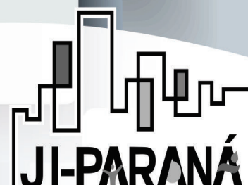
VOCÊ MERECE UMA CIDADE MELHOR!